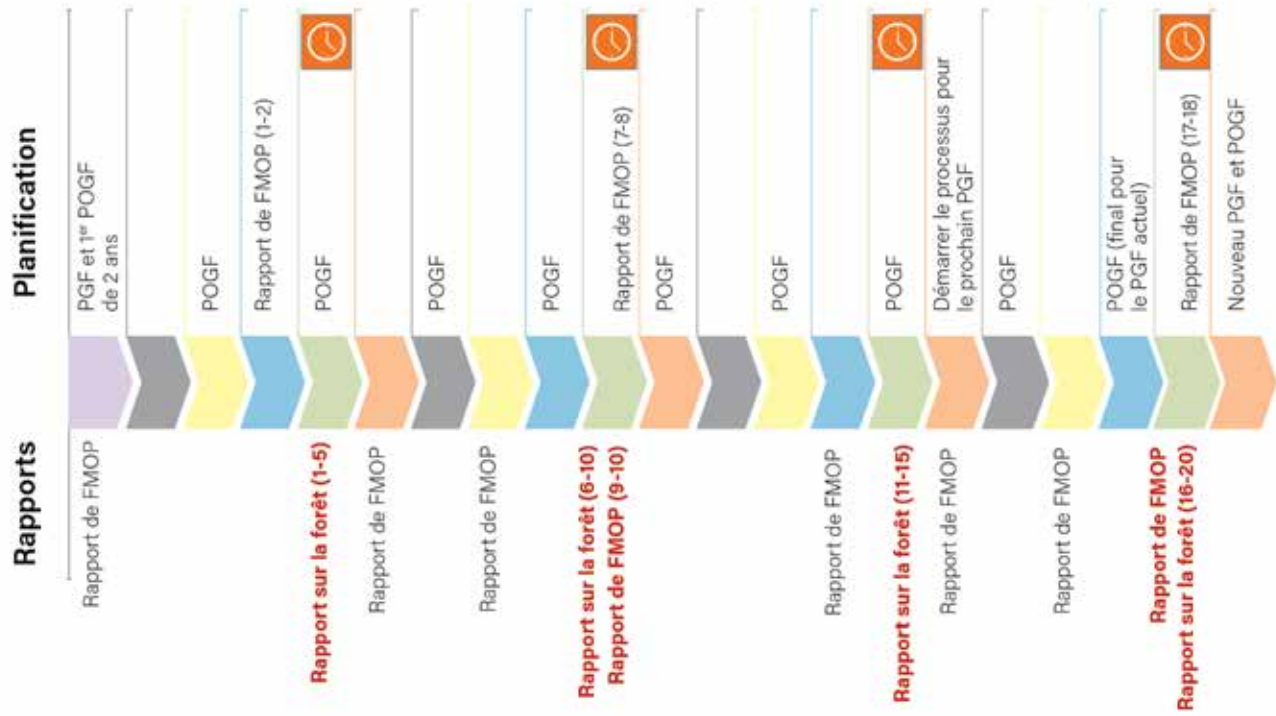
Figure 1 – Calendrier des exigences de planification et de rapport de la gestion forestière de 20 ans du Manitoba.