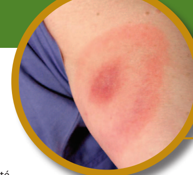
Figure 3 : érythème migrateur sur le bras d'un patient. L'Érythème n'a pas toujours la forme concentrique que l'on voit ici.