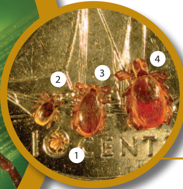
Figure 1 : stades du développement de la tique à pattes noires (1-larve, 2-nymph, 3-mâle adulte, 4-femelle adulte). Échelle : les tiques reposent sur une pièce de 10 ¢.